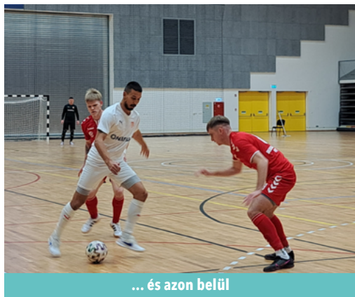
... és azon belül