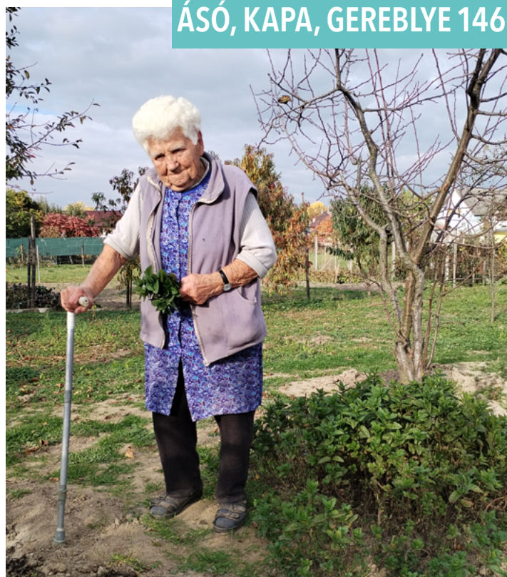
ÁSÓ, KAPA, GEREBLYE 146.

– Elöttem lehetetlen nem volt – mondja büszkén. – Minden istenáldotta reggel hordtam Kanizsára a tejet, akár esett, akár nem, mert tanyán nőttem fel, a Sormáshoz