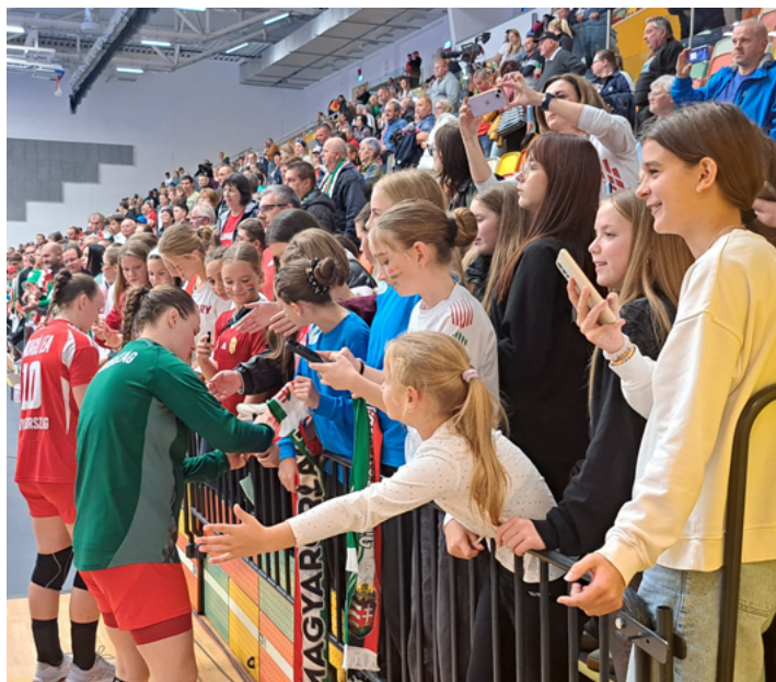
A nagykanizsai találkozót követően pedig következhetett a legfiatalabb szurkolók nagy-nagy öröme az aláírások és szelfik „harmadik” félidője...

kedett be. A magyar válogatott szakmai stábjá ezúttal is alapos munkát végzett – talán a közelgő világbajnokság jegyében is –, hiszen a kanizsai tréningeket határozottan zárt kapusnak minősítették. Ez érthető döntés volt, a közönség pedig amúgy is